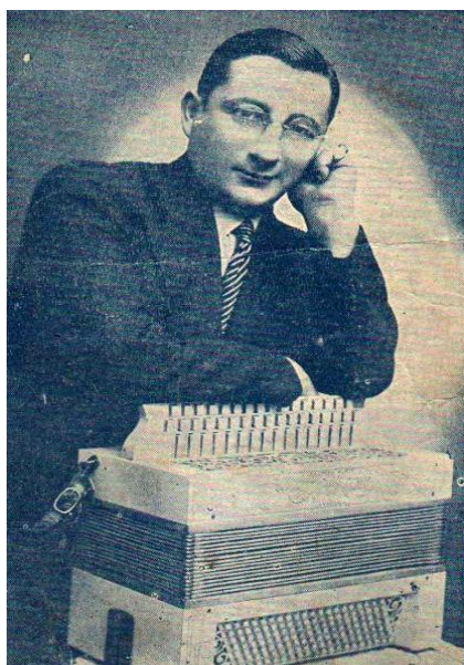
Władysław Kaczyński (1883 – 1952) Prekursor akordeonistyki polskiej